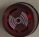
报警器 Alarm LED