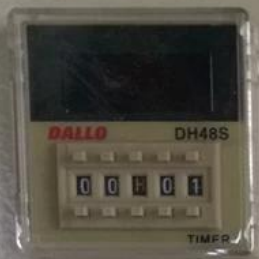
计时器 Time Control