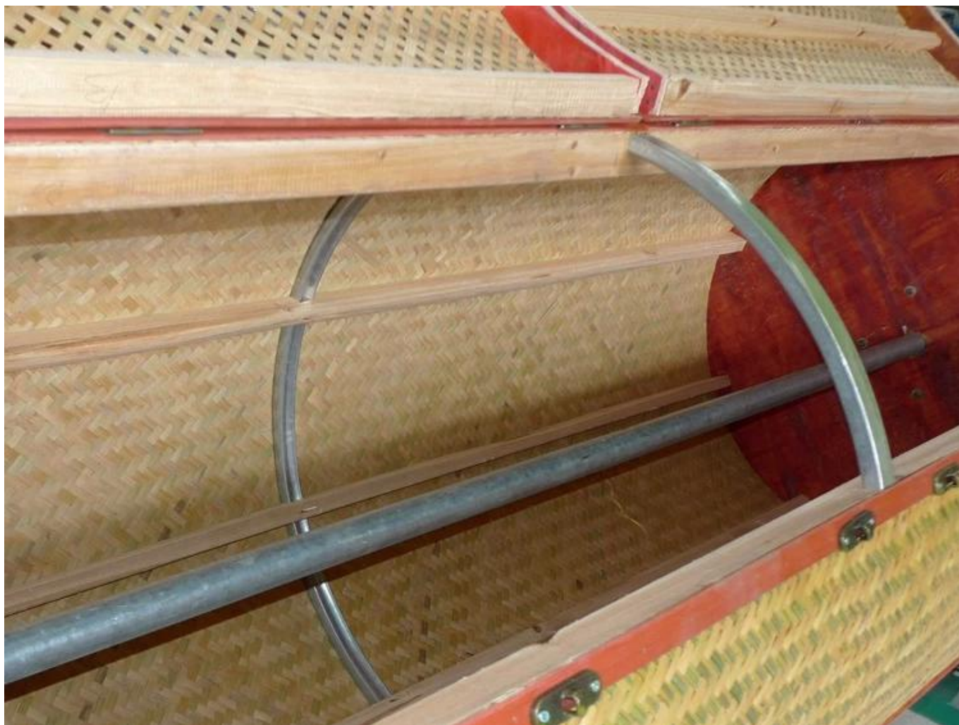
Thiết kế gia cố bằng ống thép và vòng thép, máy chạy êm, độ rung thân máy nhỏ.