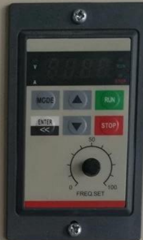
调速器 Speed Control