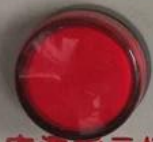
电源指示灯 Power LED