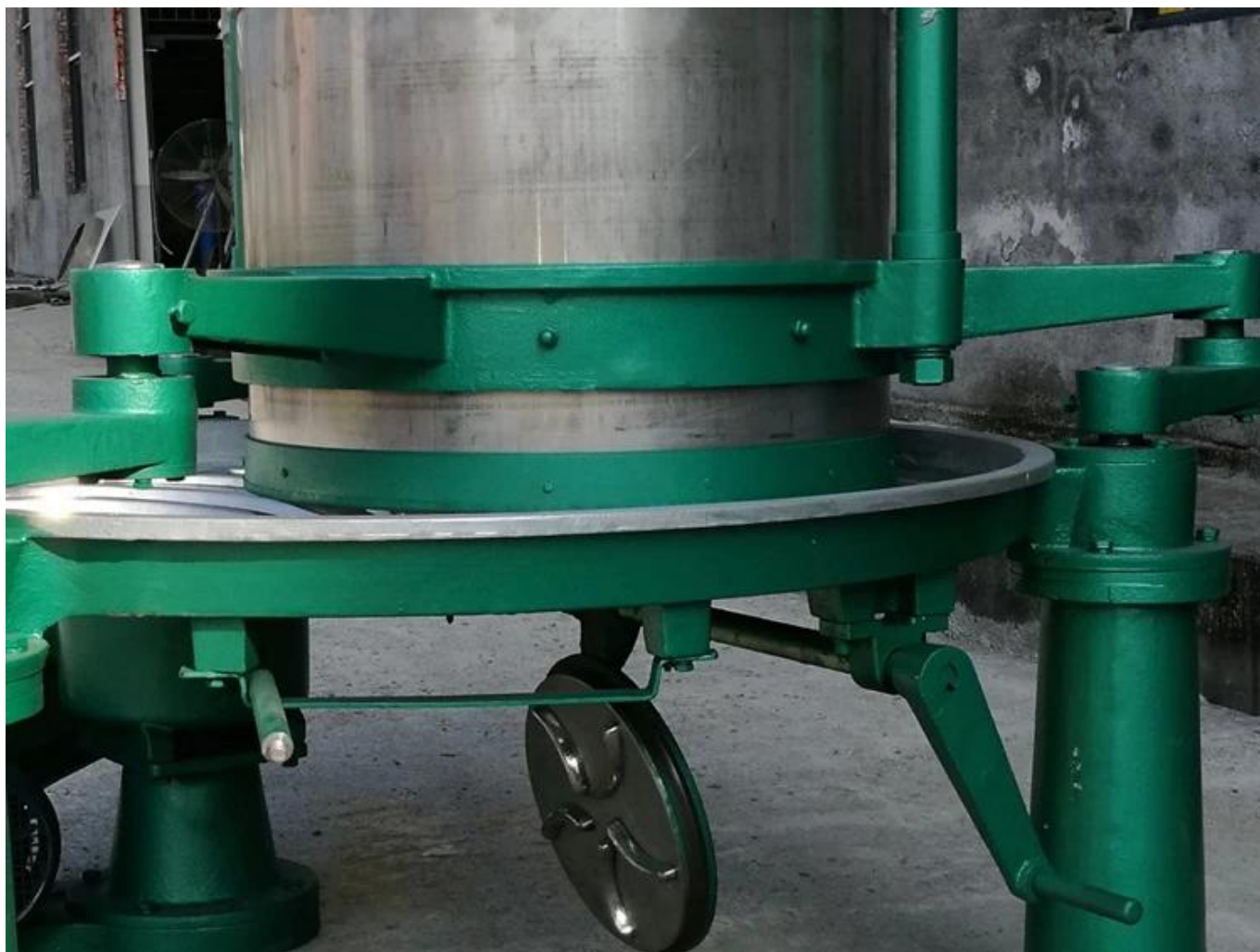
Bộ phận đỡ của máy được làm bằng gang đúc chắc chắn và bền bỉ.