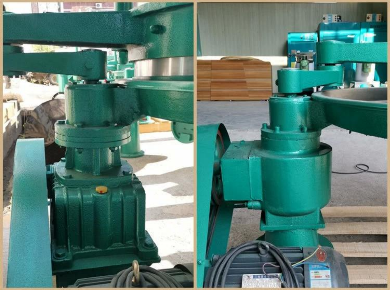
Thiết kế hộp số con sâu tuabin, giảm tốc ổn định và bền bỉ.