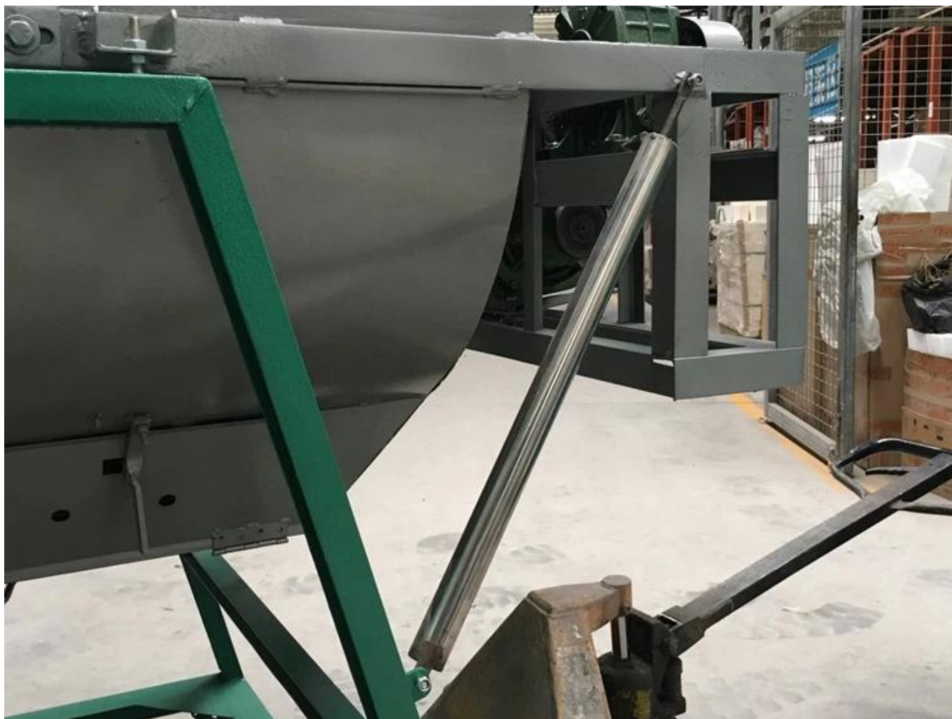
Thiết kế giảm sóc bằng khí nén, máy tự động lùi, tốc độ rơi ổn định.