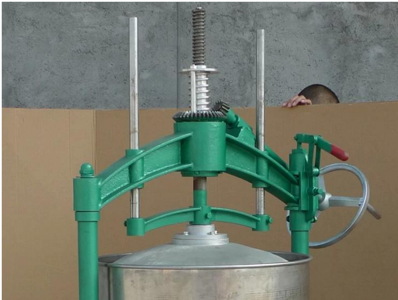
Tay đòn kép áp dụng kết cấu cánh kép mở nắp, có khả năng chịu lực và hoạt động ổn định.